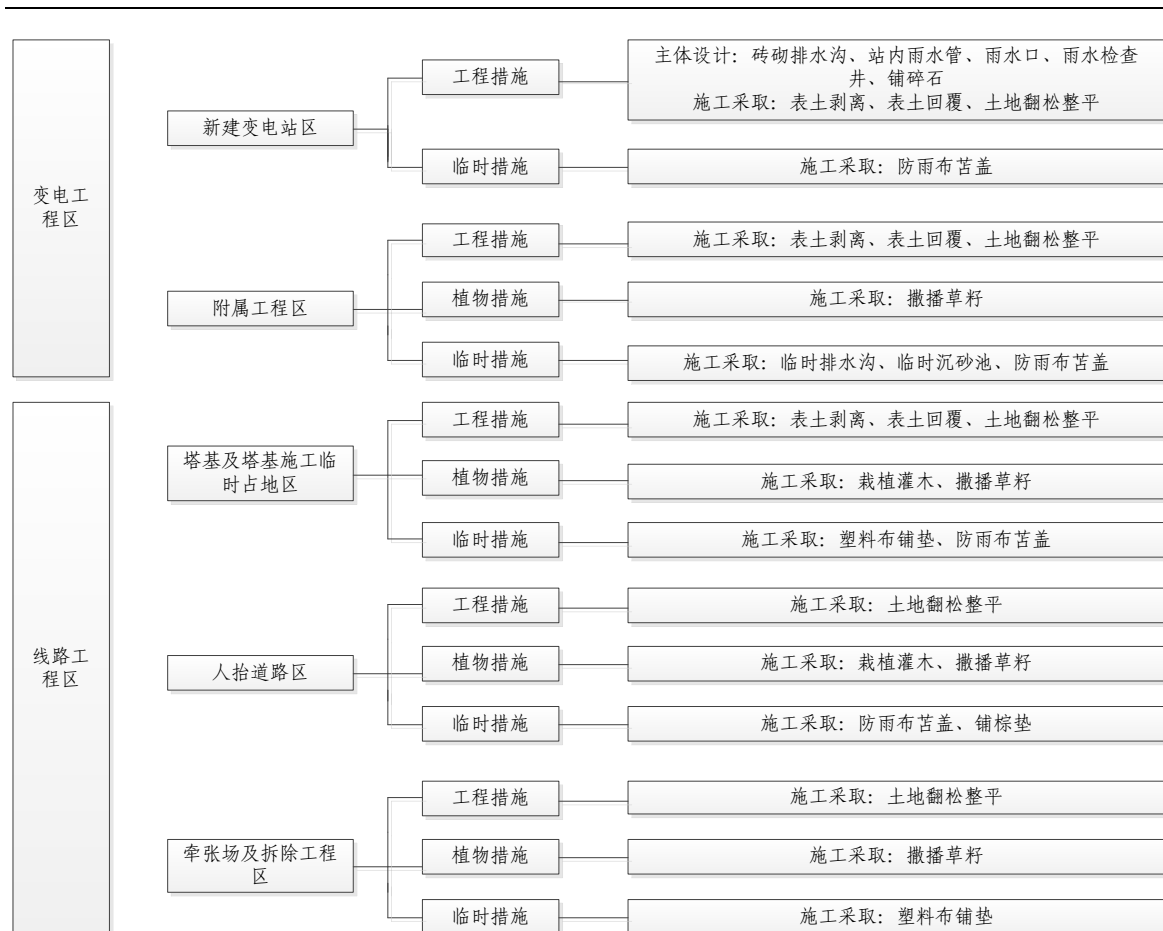
图 5.2-1 防治措施体系框图