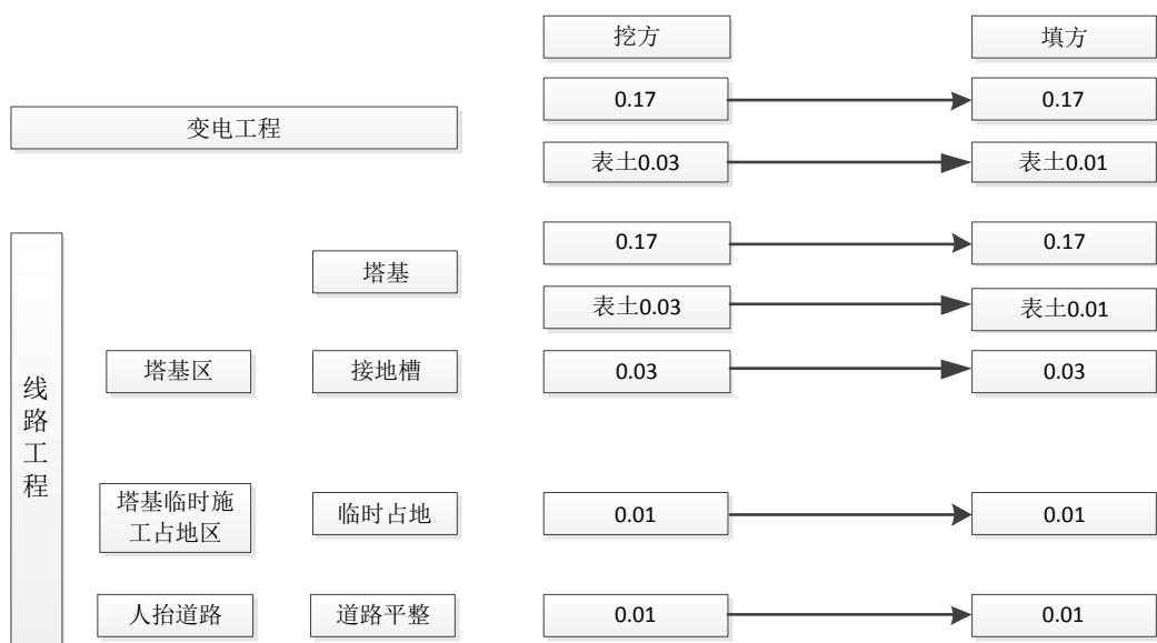
图 2.4-2 土石方流向框图